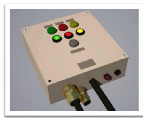
Entradas de cables incorrectas Ausencia de tornillos en envolventes