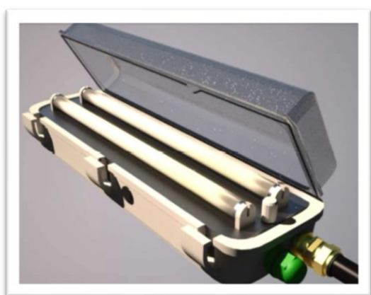
Luminarias inadecuadas Rotura en juntas