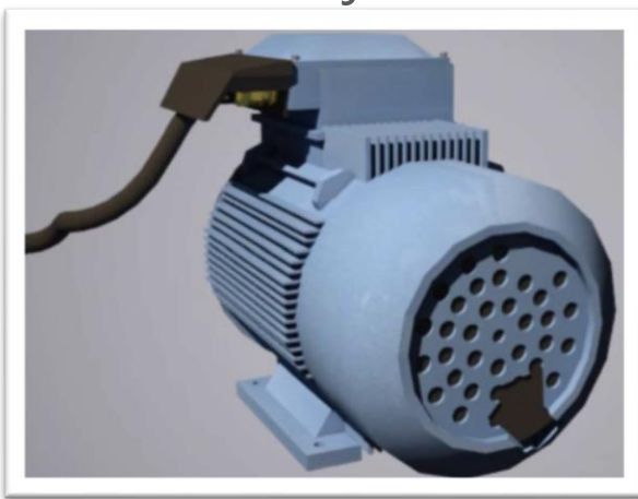
Roturas de carcasas